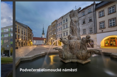
Podvečerní olomoucké náměstí

Lonely Planet, prestižní turistický průvodce