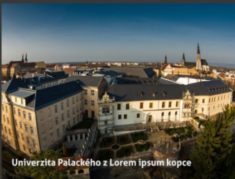
Univerzita Palackého z Lorem ípsum kopce